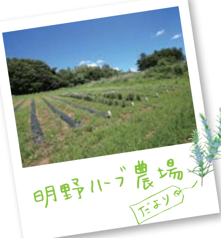
明野ハーブ農場 たよの

サンダース・ベリーでは、自社農場からとれるオリジナル原料の実用化を目指し、商品化実現にむけた農場事業に取り組んでいます。