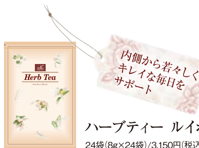
内側から若々しくキレイな毎日をサポート ハーブティー ルイボスブレンド 24袋(8g×24袋)/3,150円(税込)

ルイボス、ハト麦、クコの葉、柿の葉などミネラルやビタミンが含まれるハーブをバランスよく配合。美容・健康の維持やリラクスのおともに。