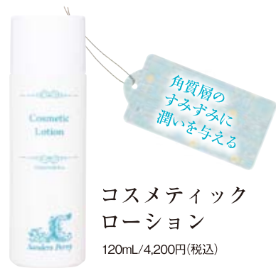
角質層のすみずみに潤いを与える コスメティックローション 120mL/4,200円(税込)