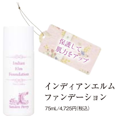
保護して肌力をアップ インディアンエルフファンデーション 75mL/4,725円(税込)

肌が敏感に傾いていると感じたら、いつも以上に肌をいたわる生活を心がけ、肌のバリア機能を回復させることが大切。ポイントは肌表面の汚れをしっかりと落とし、たっぷりと水分補給。クリームで保護して潤いをキープしていきましょう。