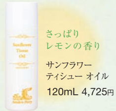
さっぱり レモンの香り サンフラワー ティシュー オイル 120mL 4,725円

『冷え』から体内代謝が落ちると、むくみが加速し老廃物がたまりやすくなります。体外へ老廃物を促すにはボディマッサージが効果的で、滑らかで軽い感触のオイルを使うとさらにスムーズ。皮脂に近い植物油は、ビタミンE、オレイン酸が豊富で肌になじみやすく、必要な油分を補って、いきいきした肌へと導きます。