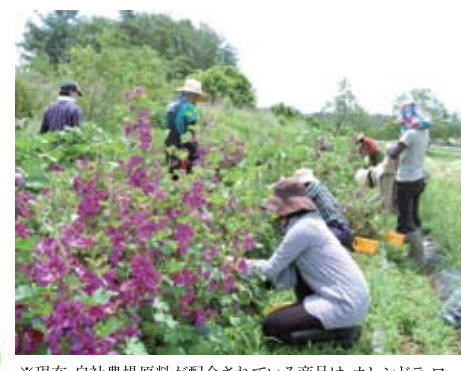
※現在、自社農場原料が配合されている商品は、 calendula ローション、マシマロ スキントニック、コスメティック ローション、リラクシング アロマ トリートメントの4品です

化粧品会社が農場をつくるというと思えないかもしれないけれど、サンダース・ベリー化粧品を有するネイチャーズウェイでは自然なこと。「肌に直接触れるものだからこそ安心して使える品をお届けしたい」、その想いで、自分たちの手で4年前から農薬を使わない有機栽培のハーブを育て、ついに自社原料を配合した製品化が実現しました。