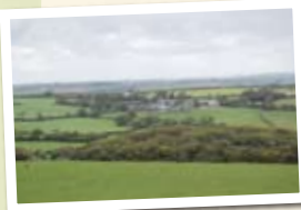
コーンウォール風景

神秘的な土地 コーンウォール イギリス南西部の自然豊かで、神話や伝説が数多く語り継がれる場所です。生命力の強いハーブが生育するこの地で、サンダース・ペリー化粧品は大切に育まれました。この場所は、かの有名なアーサー王の故郷でもあり、ハリーポッターやナルニア国物語などの撮影舞台としても有名です。魔法と妖精の聖地でもあります。