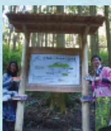
大勢の愛用者の元行われたロナルド・ハリントンこだまの森の除幕式(2009年本庄市)

2007年8月に地球環境問題の解決に貢献することを目的とした「ナチュラルコスメティクス環境基金」を設立。化粧品包装箱の簡素化により実現できたコスト削減分を、お客様が商品を1本お買い上げいただくごとに3円、環境保護活動のために積み立てています。肌がきれいになるほど、未来へ続く環境保全活動に参加できるのも、“サンダースライフ”の特長です。また、全事業所で環境ISO14001の認証も取得しています。