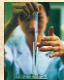
安全・安心を追求し、植物の効果効能を研究し続けています

良質の自然素材や植物素材を確保し、職人の手による「手づくり製法」で繊細な植物と対話しながら、安定した安全性を維持。毎日安心して使える、肌にやさしい化粧品を提供できるよう努めています。そして目指すのは、自然との融和により高い免疫力を保つ「健康肌」。お肌の悩みを解決するだけでなく、トラブルの起こりにくい肌になることが、サンダース・ペリー化粧品の特長といえます。