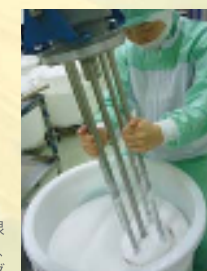
植物の力を最大限生かす伝統製法、手作業でのミキシング

私たちは多くの方に、自然の恵みを取り入れた、やさしさと香りのある豊かな生活“サンダースライフ”を送ってほしいと願っています。そのために今できること… Beauty Ecologyが私たちの信念です。