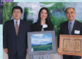
森林再生活動を行う「財団法人 尾瀬保護財団」への環境基金贈呈式の様子(2008年)