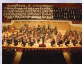
2008年サントリーホールで行われたチャリティコンサート

アロマの効果で疲れた人を応援するとともに、癒しを提供できる化粧品でありたいと願っています。また、製品にクラシック音楽を聴かせ、植物の効能を引き出す製法を取り入れています。それにちなみ、クラシックでアンチ・ストレスを、と考へ毎年チャリティコンサートを企画・運営しています。その収益の一部は文化支援や人道支援などの社会貢献活動に寄付されます。