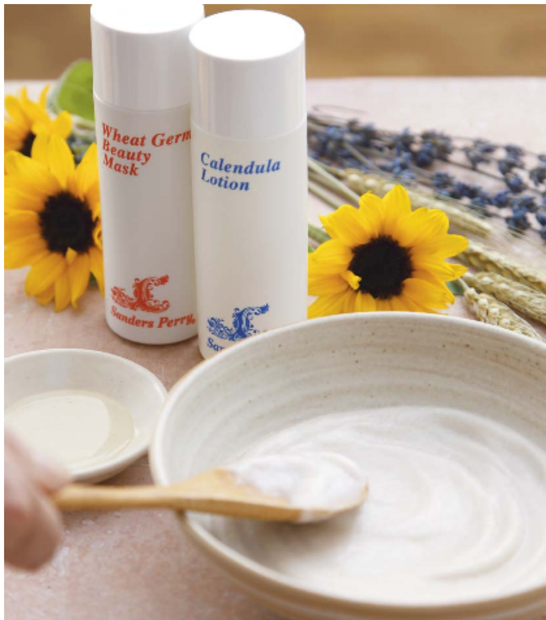
ウィートジャーム ビューティー マスク 120mL ¥4,725(税込) C ローション 120mL ¥4,200(税込)