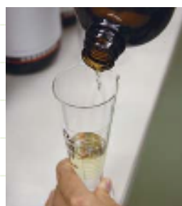
サンダース・ペリー化粧品で使われている厳選された精油は15種類

合成香料を一切使用せず、エッセンシャルオイル(精油)を使用しています。寒天製法により精油をフレッシュな状態に保つことが出来るため、スキンケアと同時にアロマ効果を楽しむことができます。すべての製品に、その使用場面や効用にあわせた香りをブレンドし、毎日のお手入れを特別な時間にできるように工夫しています。アロマセラピストのお客様が多いのも、精油そのものの自然な香りに癒されるからのようです。