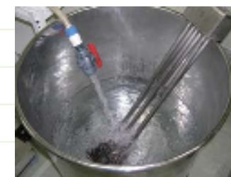
使う量だけをその都度精製し使用

一般的に化粧品で使用される精製水に比べ、微生物の代謝物までを取り除いた医薬品などにも利用される安全でクリアな水を使用しています。サンダース・ペリー化粧品は、繊細な植物成分を豊富に配合しているため、最も効果を発揮しやすいように、製品環境を整えているのです。きれいな水は、植物にも肌にもやさしい、こだわりの原料でもあります。