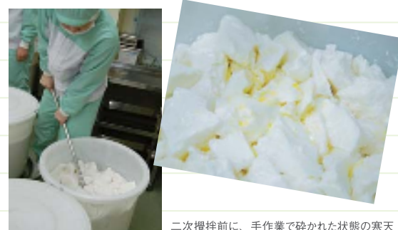
二次攪拌前に、手作業で砕かれた状態の寒天

サンダース・ペリー化粧品は寒天を主成分とし、その効用を製品によって使い分けています。もっとも実感できるのは保湿効果。それは、寒天の食物繊維がつくる「モイストチュアネット」が肌の上で水分を保ち、みずみずしさとしっとり感を持続させるからです。ミネラルを多く含む健康食品でもある寒天は、身体にも肌にも効果のある優秀な美容成分といえます。