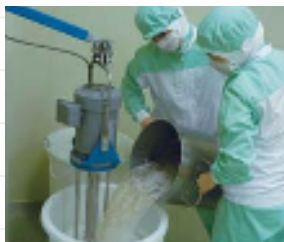
時間、回転数、スピードなど詳細レシピに基づく手作業によるミキシング