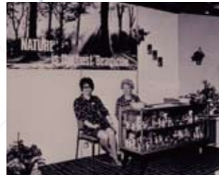
ロンドンの食品展覧会の様子。

ロンドンで開催された食品展覧会で紹介され、運命的な出会いで日本上陸。日本の自然化粧品の先駆けとなる。