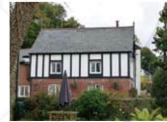
イギリス・コーンウォールにあった、「Flora Place」と名づけられた工場。

1つのクリームが評判を呼び、植物のみならず保存方法も含め、本格的に化粧品の研究を始める。