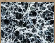
カンテンゲルの電子顕微鏡写真(×15000)

●水をたくさん抱え込む性質の「モイスチュアネット」を活かした、高い保湿効果 ●寒天繊維フレッシュカプセルにより、一緒に配合する成分をフレッシュな状態でキープ ●合成界面活性剤を使わない新乳合法なので安全で安心