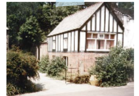
イギリス・コーンウォールにあった「Flora Place」と名づけ られた工場