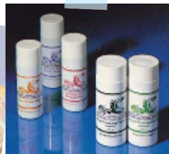
1980年代日本に輸入され始めた頃の ボトルデザイン