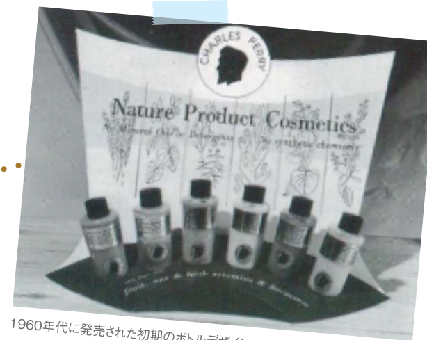
1960年代に発売された初期のボトルデザイン