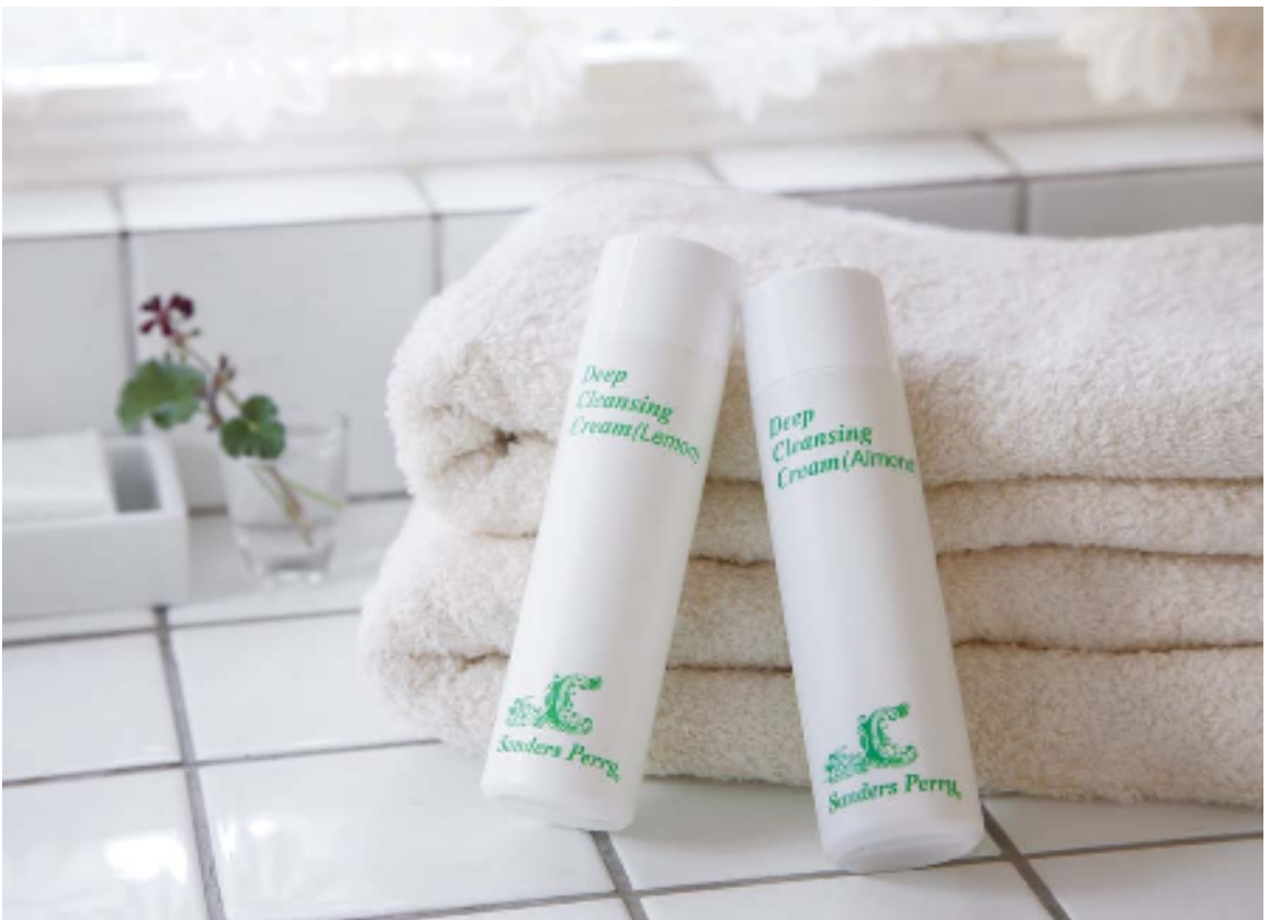
ディープ クレンジング クリーム LN ディープ クレンジング クリーム AD 150mL 各¥4,200(税込)

朝起きたてで肌がくすんでいると感じたときは、クレンジングLNを、お顔全体にたっぷりつけて、身支度をしながら5分間の「クレンジングパック」をしましょう。その後は、いつもと同じように拭き取って終了。このひと手間が明るい肌を取り戻し、メイク持ちを良くするスペシャル技です。肌にやさしいクレンジングならではの使い方です。