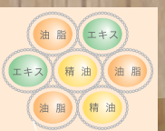
寒天繊維(フレッシュカプセル)