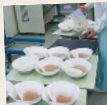
不純物を取り除く過作業

新鮮な状態でお届けするために サンダース・ペリー化粧品は、製造から お客様のお手元まで、早いもので1週 間で届きます。これは、ハリントン氏の 意思を受け継ぎ、「手作り製法」 「鮮度 = 最小限の防腐」 「安心できる品質」を心がけ、 作り置きをせず常にフレッシュな状態を 保つためです。