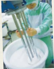
60年前から受け継がれた 職人の手によるミキシング